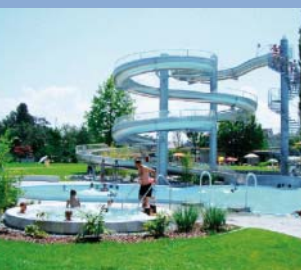
Piscinas «See Bad»