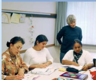
Curso de alemão

Romanshorn é o Porto Matriz da frota suíça do Bodensee. Os ferry-boats são as «pontes aquáticas» entre a Alemanha e a Suíça, ou melhor dizendo, entre Friedrichshafen e Romanshorn. Mais informações sob: www.bodensee-schiffe.ch