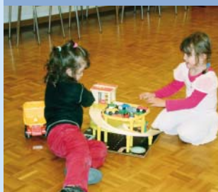
Infantário durante os cursos de alemão