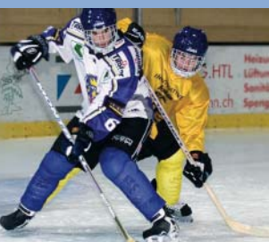
Centro de patinagem