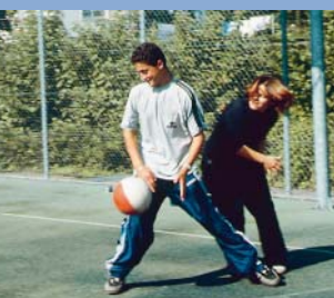
Campo de desporto