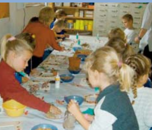
Grupo de convívio

A seguir ao médico, ao pessoal hospitalar e à parteira, são as conselheiras do Posto de Aconselhamento de Pais, o contacto, a seguir ao nascimento de um bebé. Como mães e perítas, estas, possuem a experiência adequada para vos ajudarem a ter sucesso como pais. Na transformação do vosso papel de marido e mulher para o papel de pais, estarão elas ao vosso dispôr. Se têm perguntas e ou problemas antes e depois do parto, questões sobre o bebé e se querem ir ao peso com as crianças, dirijam-se ao Posto de Aconselhamento de Pais no Konsumhof 3, Tel. 071 463 3255. www.exxa.ch