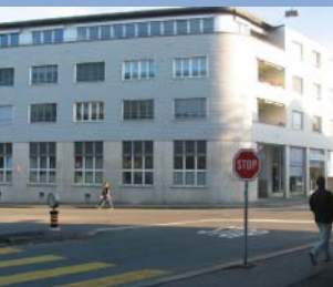
Aconselhamento de pais