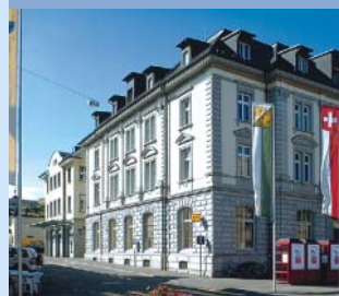
Posto de Correios