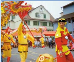
Festa das Nações

O Seeblick é uma publicação oficial do Município de Romanshorn. Neste vêm publicadas muitas informações úteis e interessantes. O Seeblick é semanal e é distribuído gratuitamente a todos os endereços. E-Mail: seeblick@romanshorn.ch