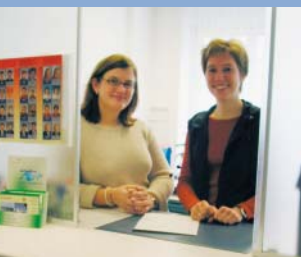
Posto de Control de Habitantes