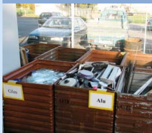
Lixo/Serviço de Obras