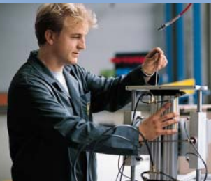
Permisso de trabalho