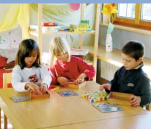
Jardim de Infância

As escolas Real e Secundária dedicam-se, de formas diferentes, à pré-formação profissional. O frequentamento da Escola Real permite preparar os alunos na aprendizagem de uma profissão. Os que frequentam a Escola Secundária têm a possibilidade de fazerem testes de acesso a escolas superiores (Escola Média, Escola Superior de Pedagogia, Escola Cantonal, etc.).