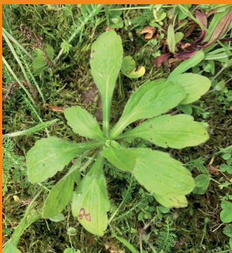
Überwinterung als Rosette