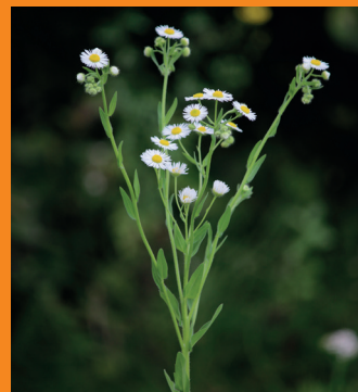
Behaarte Stängel, oben verzweigt, bis 1,5 m hoch