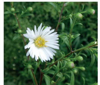
Lanzettblättrige Aster Blütezeit ab August. Blätter dunkelgrün, schmal, nur fein gezackt, ohne Haare