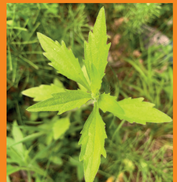
Hellgrüne behaarte Blätter, am Rand grob gezähnt