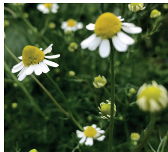
Echte Kamille Geteilte Blätter, breite Zungenblüten, stark aromatisch