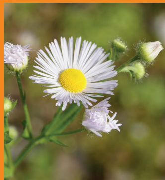
Blütenkörbchen 1–2 cm breit, viele schmale Zungenblüten in weiss bis lila, blüht von Mai bis Oktober