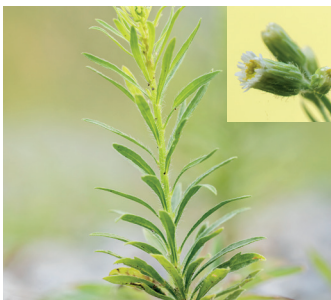
Kanadisches Berufkraut Ein Hauptstängel, rund 100 Blüten, kurze Zungenblüten