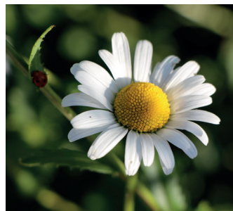
Wiesen-Margerite Blütenkörbchen ca. 5 cm breit, mit breiten weissen Zungenblüten. Unverzweigte Stängel