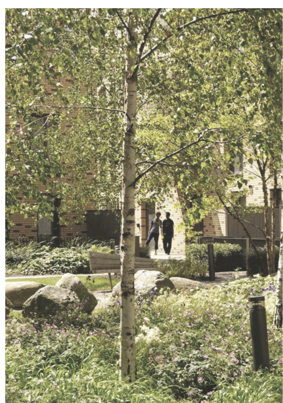
Referenz - Gartenhof (vetschpartner)