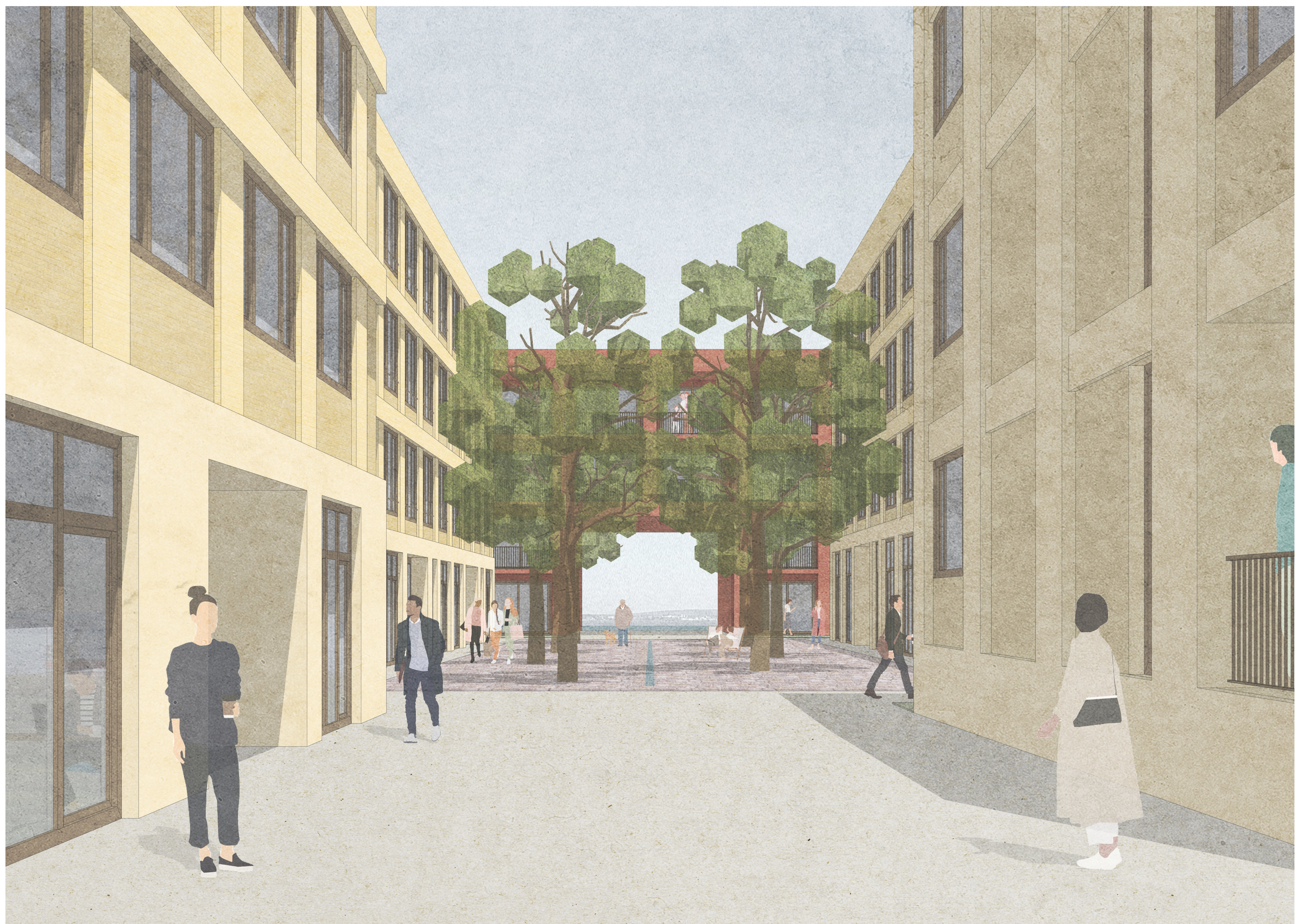
Perspektive Fabrikplatz von Badstrasse