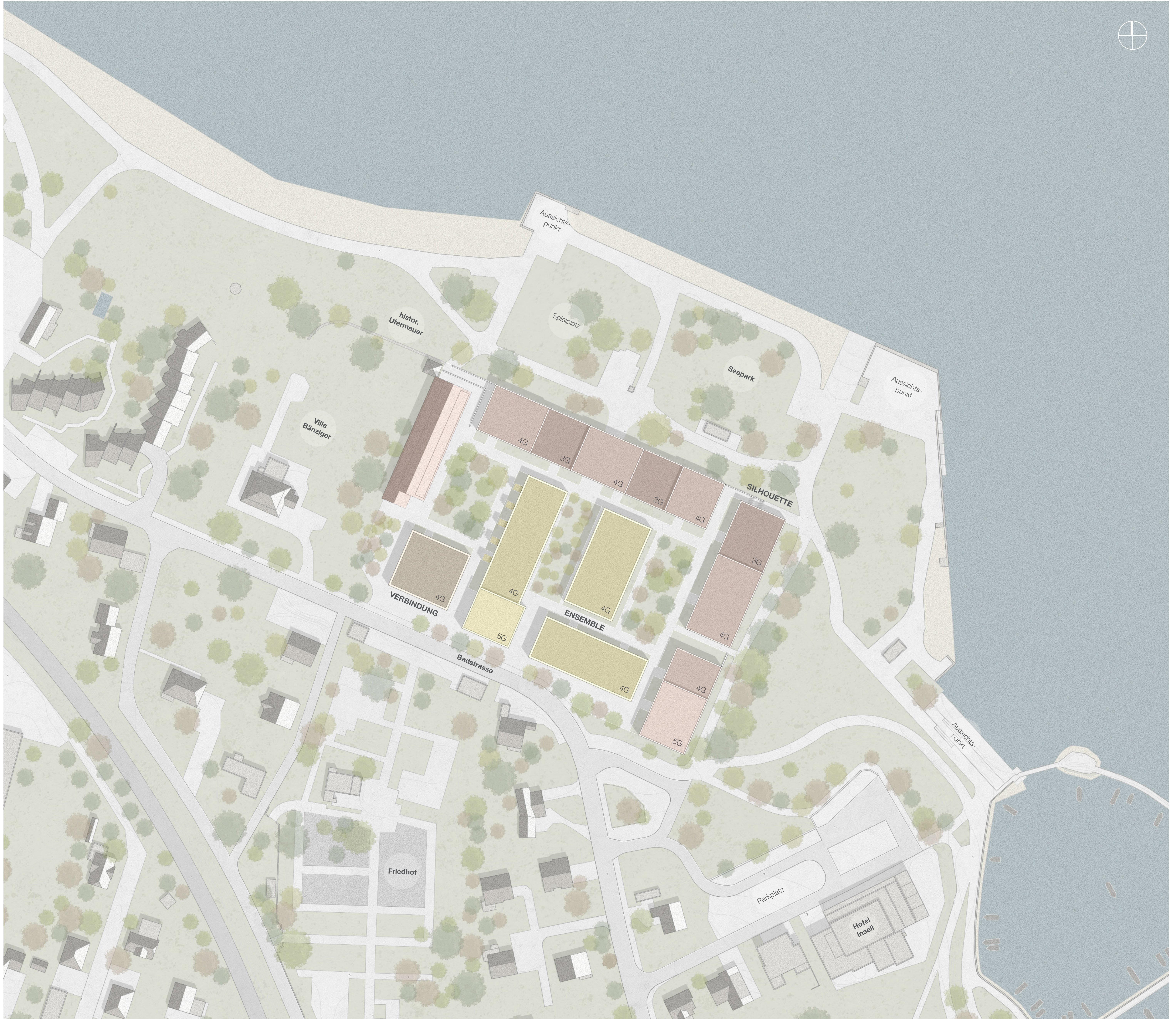
konzeptueller Lageplan 1:500