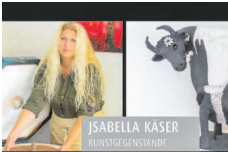
JSABELLA KÄSER KUNSTGEGENSTÄNDE